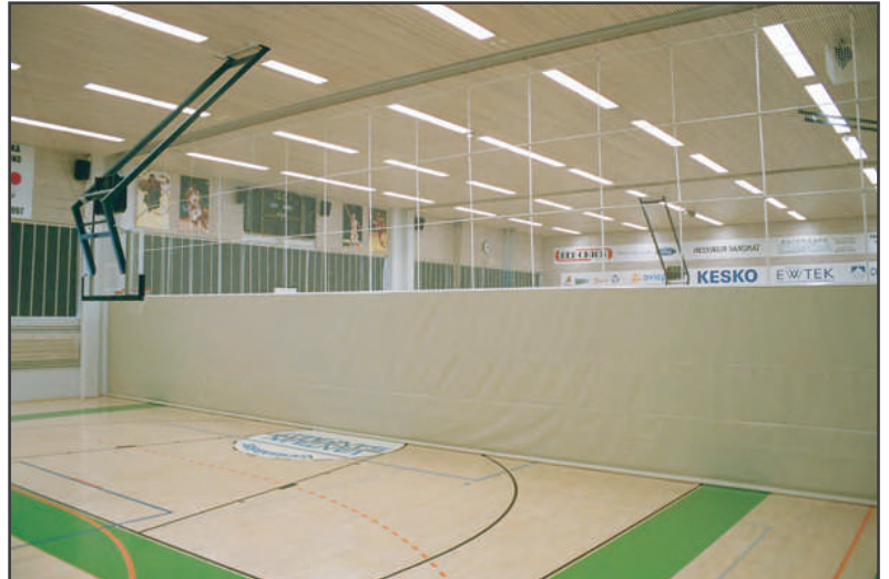
Myyrmäen urheiluhalli, Vantaa

Laskosnostoseinät suunnitellaan aina yksilöllisesti vastaamaan tilojen tarpeita. Käytämme laskosseinissämme aina testattuja ja luokiteltuja materiaaleja sekä komponentteja, joilla takaamme seinien turvallisen toiminnan.